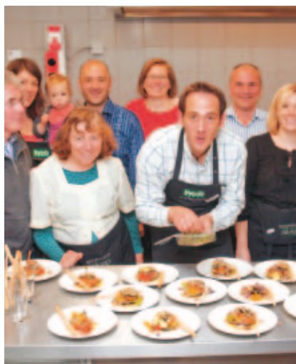
Es ist angerichtet! Das Koch-Team freut sich auf den Ratatouille-Salat.